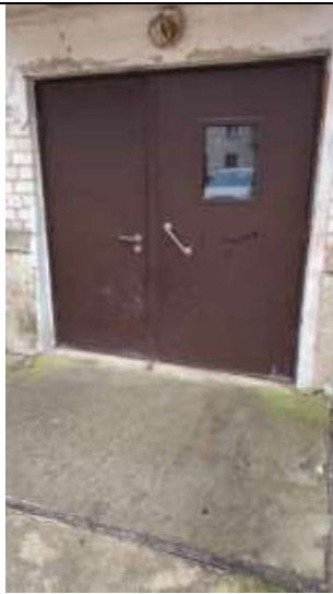
Kāpņu telpas ārdurvis